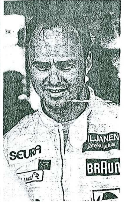
• "Ikää ja kokemusta on nyt sopivasti".