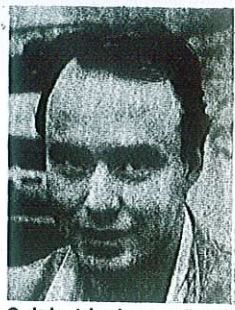
● Jarin tulevaisuus vaikuttaa taas huomattavasti valoisemmalta.